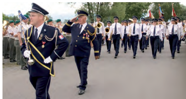
Unser MV Fußach, einer der wichtigen Träger der Kultur in unserem Dorf.

Bei den Wahlen im April 2005 erhielt die Fraktion Freie Wählergemeinschaft Fußach bei einem Stimmenzuwachs von über 2 % mehr als 50 % der Stimmen. Bürgermeister Ernst Blum wurde mit 61 % der Stimmen deutlich im Amt bestätigt.