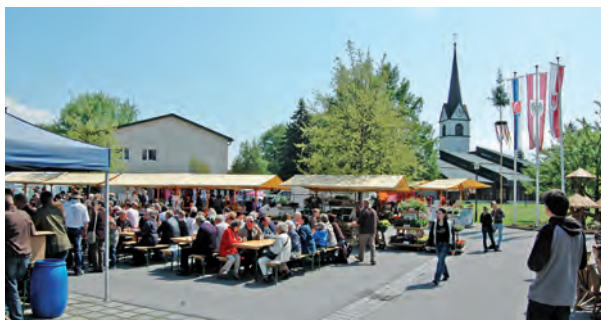
Der Fußacher Markt der WIF ist seit zehn Jahren beliebter Treffpunkt.